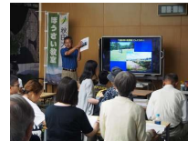
市民向け防災教室