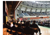
式典の様様 (平成30年度卒業式)