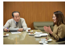
学長と学生の懇談会