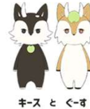
キス と くす