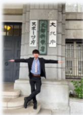
行政実務研修最終日の様子…「文」の字を表しています(?)