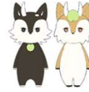
キース と くーす