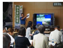
市民向け防災教室