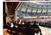
式典の模様 (平成30年度卒業式)