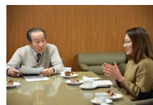
学長と学生の懇談会